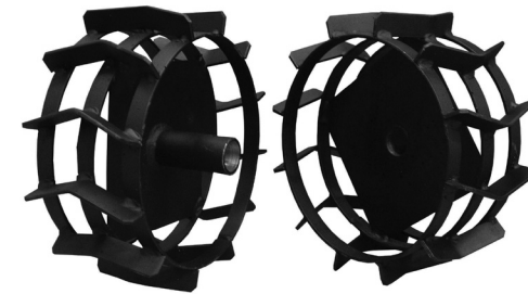
ГРУНТОЗАЦЕПЫ ШИРОКИЕ — АРТИКУЛ ДЛЯ ЗАКАЗА: С3001